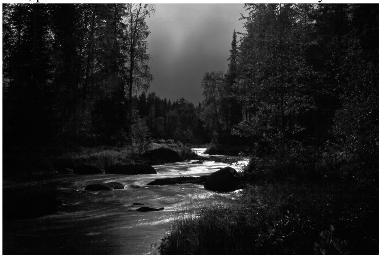
Osa muistitiedon keruuseen osallistuneista lähetti myös esimerkkejä omista vedoksistaan.

Suurin osa ammattilaisista oli jo luopunut pimiötyöskentelystä, ja