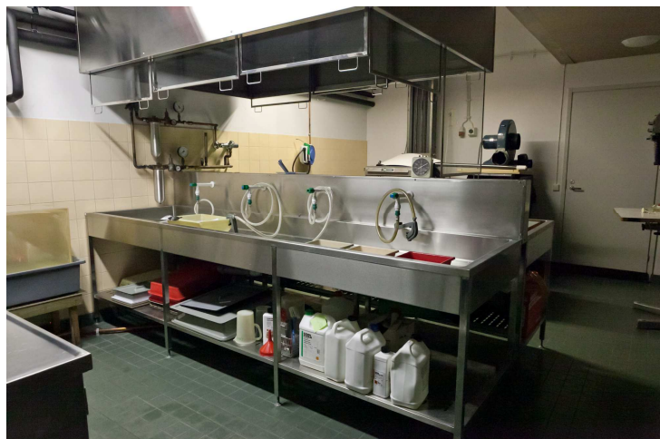
Suomen valokuvataiteen museon pimiön huuhtelualtaita.