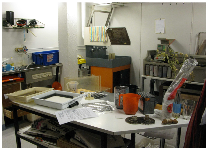
Ylioppilaskameroiden yhteisöpimiö.

Suomen valokuvataiteen museon oma pimiö tallennettiin valokuvaten. Pimiö on esimerkki hyvin varustellusta ammattilaispimiöstä, jota on käytetty suhteellisen vähän. Museon muuttaessa uusiin tiloihin pimiö suunniteltiin kokonaan alusta vastaamaan vaativiinkin tarpeisiin. Pimiö valmistui