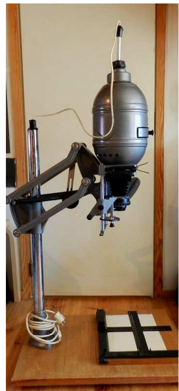
Kokoelmiin hankittu Neva-suurenuskone 1960- luvulta.