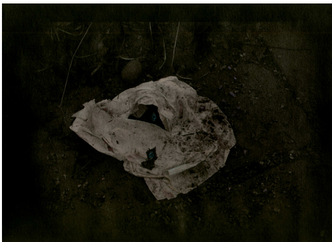
Keruuvastausten liitteinä saatiin esimerkkejä perinteisestä ja kokeilevasta vedostuksesta.

Osassa vastauksista laaja kysymyspatteristo oli ehkä turhankin voimakkaasti hallinnut vastaajan